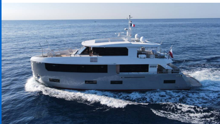
LAYOUT AEGEAN 26 M

Luxusní jachty AEGEAN EXPLORER M26 Ukiel , rok spuštění na vodu 2022 kotví v marině Olbia, Sardinie (Itálie), Itálie . Počet kajut: 8 , může ubytovat celkem: 12 a má toalet: 8 . Povlečení a kuchyňské vybavení jsou zahrnuty v ceně.