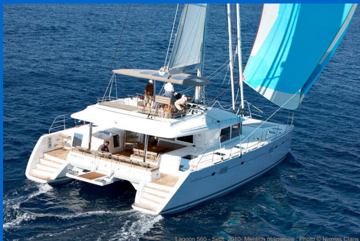
Lagoon 560 - Sept. 2010 - Mentioa obligatorie - Photo © Nicolas Claris

Katamarán Lagoon 560 Topaz , rok spuštění na vodu 2017 kotví v marině Split, West Coast (Zapadna obala), Splitský region (Chorvatsko), Chorvatsko . Počet kajut: 5 + 2 , může ubytovat celkem: 10 + 2 a má toalet: 5 + 1 . Povlečení a kuchyňské vybavení jsou zahrnutá v ceně.