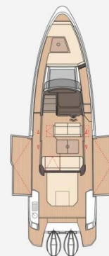
Main deck with side terraces open