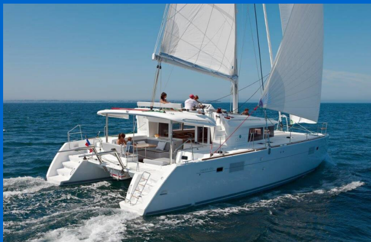
Lagoon 450 - Maritim catamaran

Katamarán Lagoon 450 F Anja, rok spuštění na vodu 2019 kotví v marině Rogoznica – Marina Frapa, Šibenický region (Chorvatsko), Chorvatsko. Počet kajut: 4 + 2, může ubytovat celkem: 8 + 2 + 2 a má toalet: 4. Povlečení a kuchyňské vybavení jsou zahrnuty v ceně.